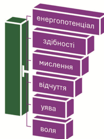
Рис. 2. Складники таланту за В. Моляко

Ґрунтуючись на дослідженнях науковців і послуговуючись власними науковими розвідками, підсумовуємо, що талант потребує постійного вдосконалення шляхом саморозвитку та практикування у творчій взаємодії дитини та дорослого. Вроджені задатки створюють основу, але без розвитку та практики вони можуть залишитися нереалізованими. Водночас, наполеглива праця без природної схильності теж може привести до високих результатів, хоч і потребуватиме більше зусиль.