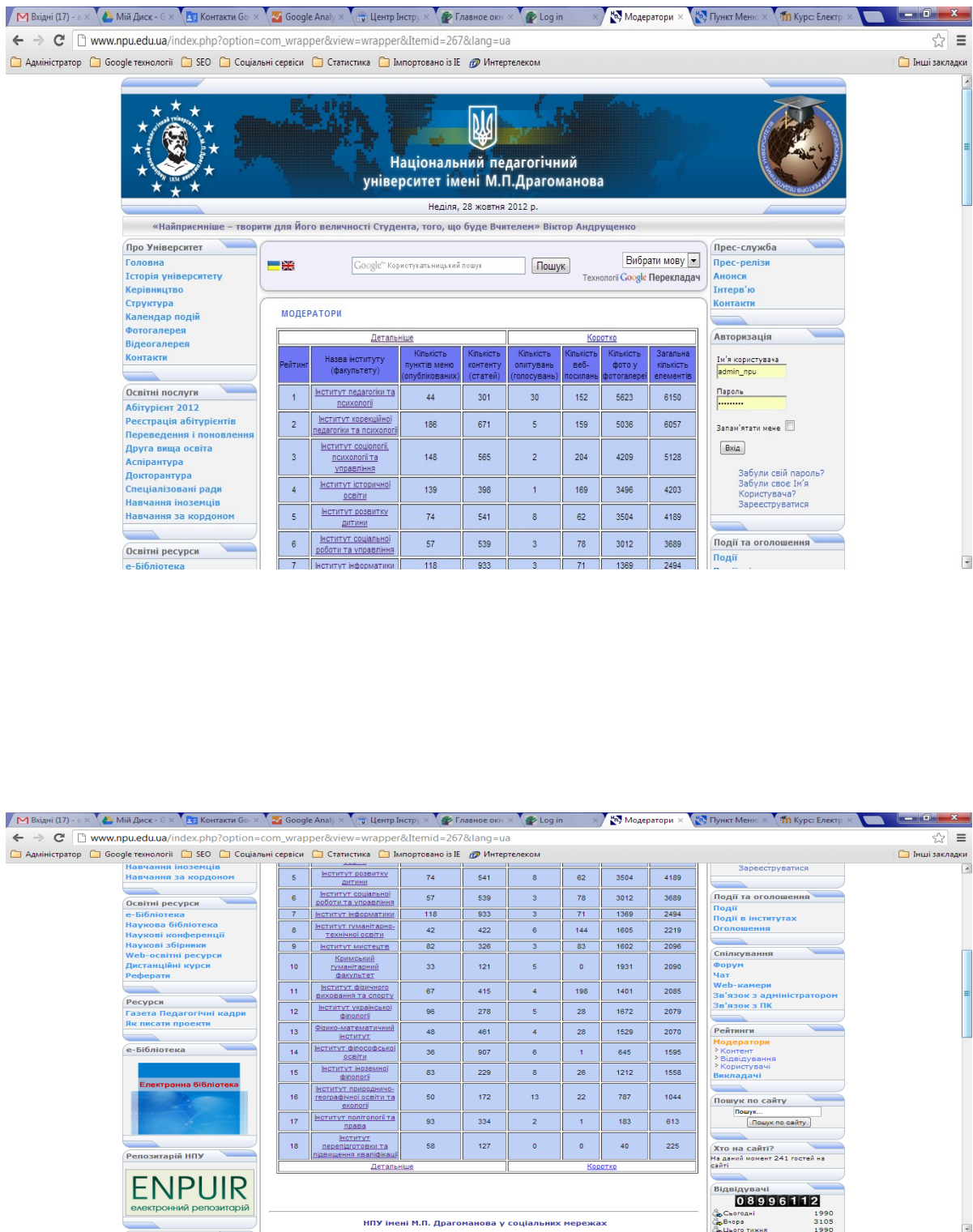
Рис. 2. Демонстрація на порталі www.npu.edu.ua рейтингу основних компонентів роботи модераторів сайтів інститутів

Необхідно також відмітити, що доступ до результатів рейтингу викликає підвищений інтерес у керівництва підрозділів до роботи їхніх модераторів сайтів. Безумовно, для наступних етапів функціонування порталу, коли значно