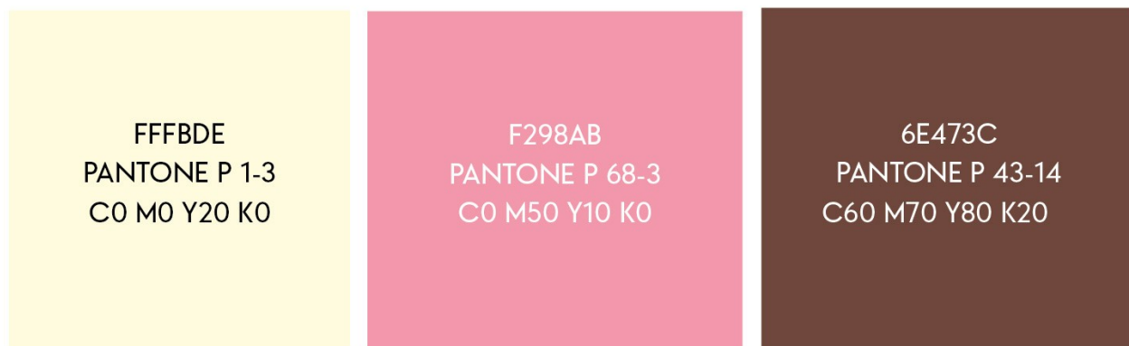
Рис.В.7 Кольорова палітра

Aa Bb Cc Dd Ee Ff Gg Hh Ii Jj Kk Ll Mm Nn Oo Pp Qq Rr Ss Tt Uu Vv Ww Xx Yy Zz