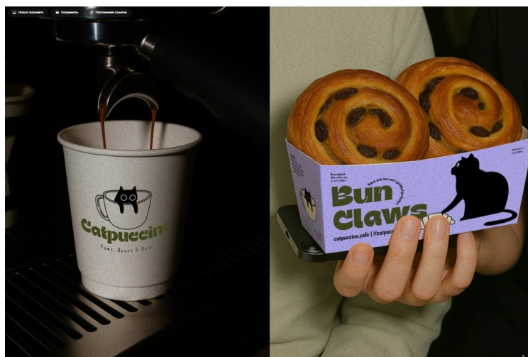
Рис. Б. 4