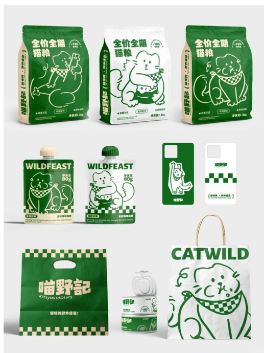
Рис. Б. 3