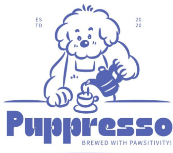
Рис. А. 1