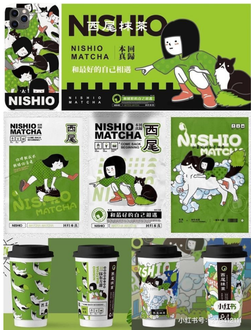
Рис. Б. 1