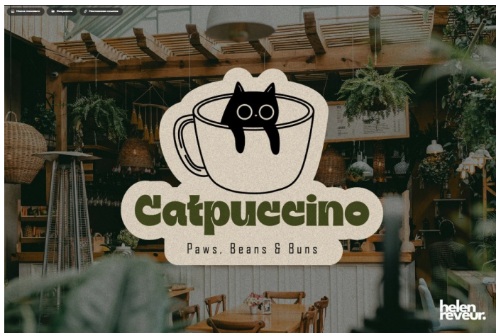
Рис. А. 3