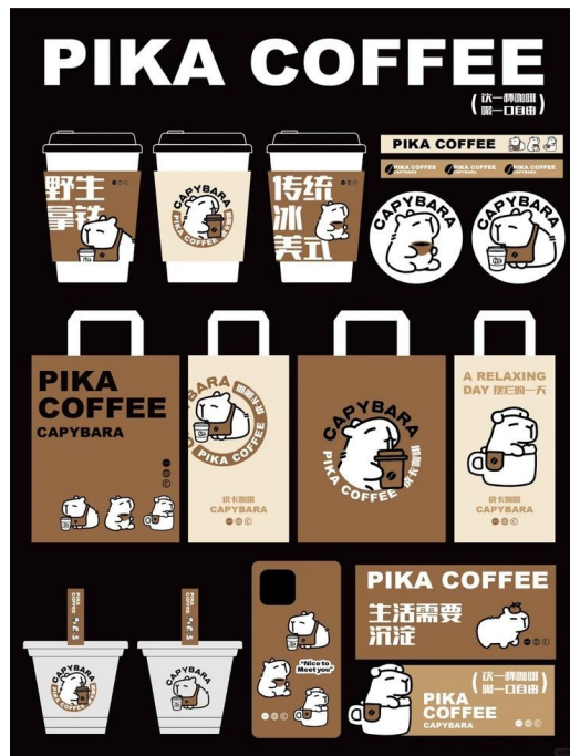
Рис. Б. 2