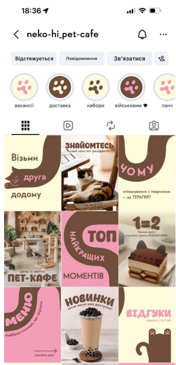
Рис.Г. 9 Лендинг-сторінка