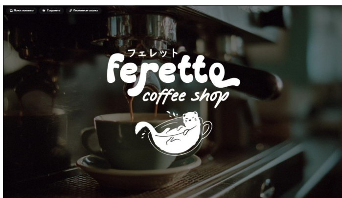
Рис. А. 2