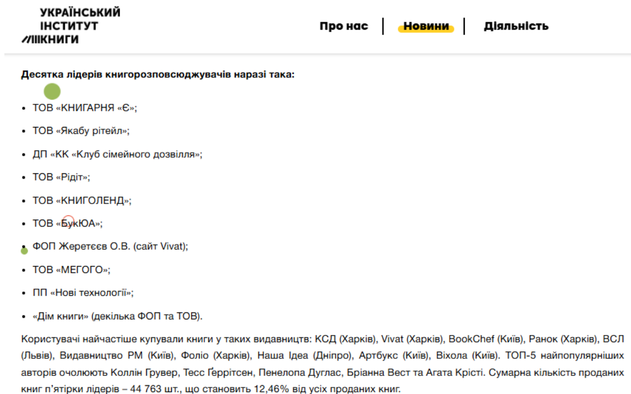
Рисунок 1.1 Статистика, виражена УІК за державною програмою «єКнига»

Сучасний український видавничий і поліграфічний ринок перебуває у стані активної трансформації. Попри складні економічні умови, книжкова сфера продовжує розвиватися, а кількість видавництв, друкарень та незалежних авторів поступово зростає. Важливим фактором розвитку книжкового ринку є також зростання інтересу до читання та купівлі книжок серед молодшої аудиторії. Зокрема, у межах державної програми «єКнига» у 2025 році 18-річні українці придбали понад 434 тисячі книжок, а загальна сума витрат склала майже 140 млн грн. За даними Українського інституту книги молодь частіше обирала книги великих та відомих в Україні видавництв, а топ найпопулярнішої літератури в основному складається з перекладних творів.