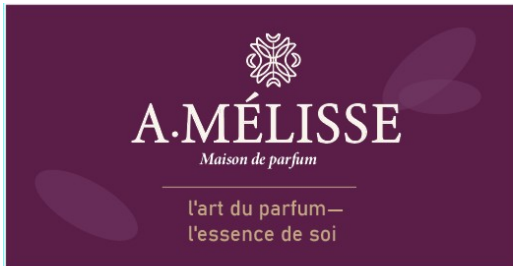
Рис. Б.2. Фірмова двостороння візитна картка бренду Amelisse зворотня сторона

Рис. Б.1. Фірмова двостороння візитна картка бренду Amelisse лицьова сторона