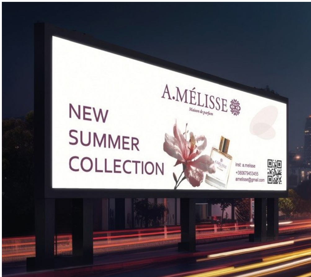
Рис. А.1. Концептуальний широкоформатний рекламний банер парфумерного дому Amelisse