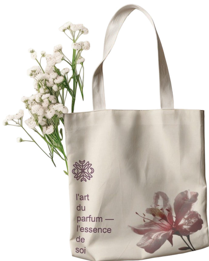
Рис. В.1. Фірмовий екологічний текстильний шопер бренду Amelisse