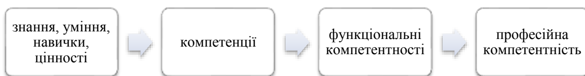
Рис. 1. Загальна структура професійної компетентності фахівця

У науково-літературних джерелах [4,7] загальна структура професійної компетентності фахівця подана таким чином (рис. 1):