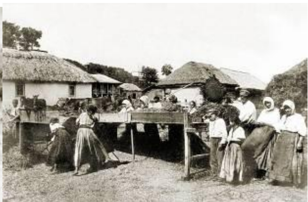
Жнива. Село Білики на Полтавщині. 1906 р.