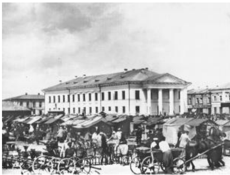
Ярмарок на площі біля Контрактного будинку на Подолі. Київ. 1902 р.

«Подискутуйте» Роздивіться фотографії, прочитайте текстівки до них. Що дізналися про походження назв – площі, вулиці та міста? Чи є назви, які бережуть пам'ять про історичні події, у вашому рідному місті (селі)? Як ви думаєте, чому пам'ять про історичні події увічнюють у назвах?