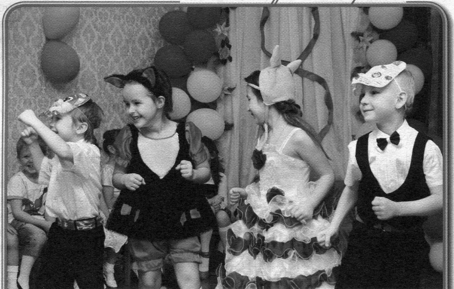
Ігри, досліди, вистави — В дії вчиться цікаво!

Ритм — природний живий механізм, що м'яко й непомітно впорядковує життєдіяльність відповідно до зміни сезонів та пір року й доби, біологічних проявів, що є характерною особливістю живих систем.