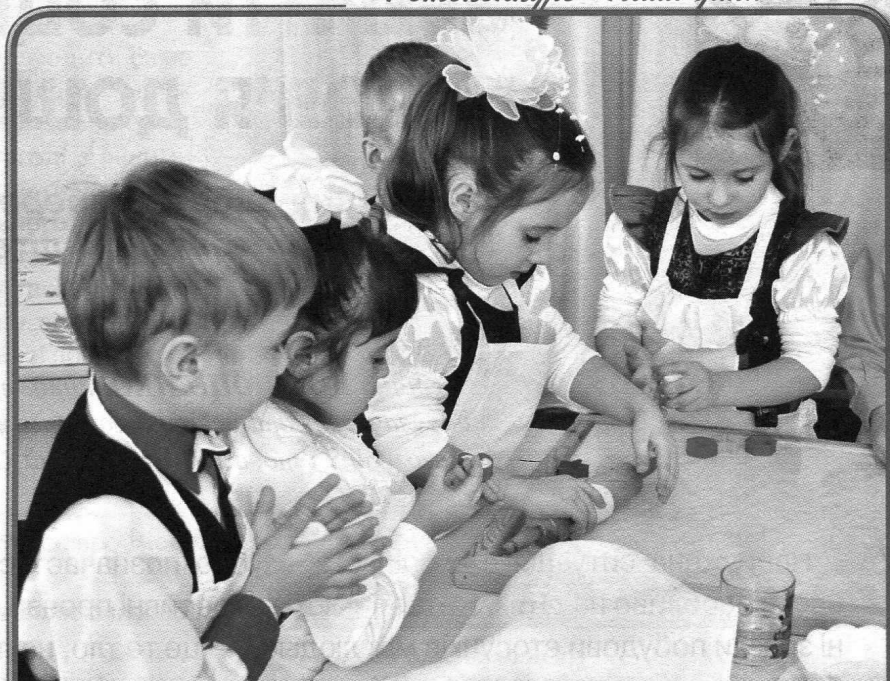
Ліпити вареники — справа приємна, Проте головне, що вона не даремна.

Педагоги разом з лікарями та іншими фахівцями уважно спостерігають за дітьми, систематично збираються на наради для обговорення особливостей розвитку кожної окремої дитини (активними учасниками цих нарад можуть бути і батьки