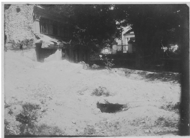
Фото 5. Склеп Галаганів під залишками церкви Петра і Павла. У глибині — ще ціла Варваринська церква. 16.06.1927 р. 56