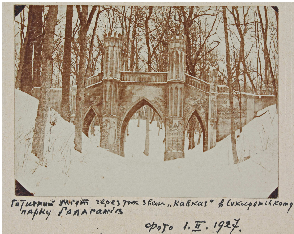
Фото 2. Готичний місток у Сокиринському парку. До сьогодні зберігся, але у стані руйнації. 1.02.1927 р. 46

спеціальну прибудову, де сушили овочі в промислових обсягах, унаслідок чого маєток мав значний прибуток 45 . Разом із цим руйнування не торкнулося споруд вхідної групи ансамблю садиби, що відмежовували її територію від навколишнього світу, та деяких господарчих приміщень, передусім теплиці, де ще до кінця 1920-х рр. зберігалися екзотичні рослини.