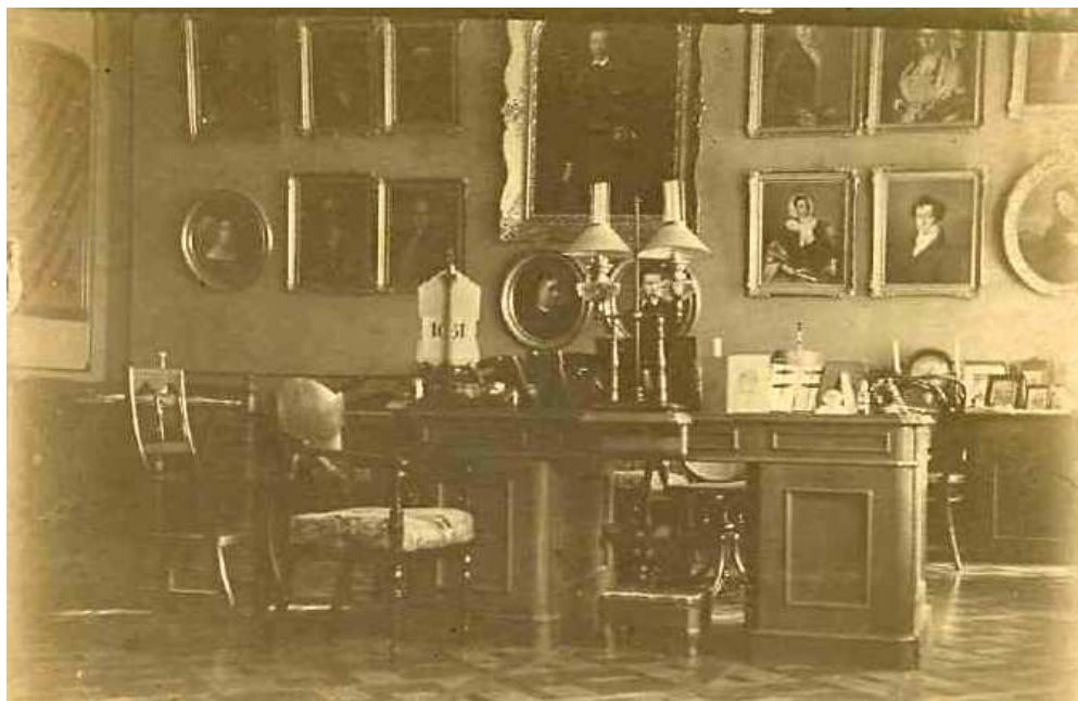
Фото 6. Кабінет палацу садиби в Сокиринцях. 1901 р. 70