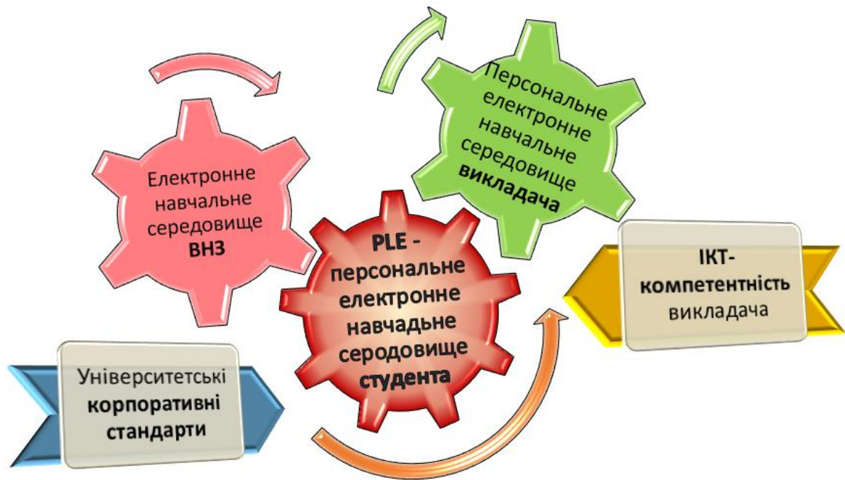
Рис. 1. Віртуальне освітнє середовище сучасного студента

Головною метою підготовки фахівця у соціально-економічних умовах інформаційного суспільства стає не здобуття ним кваліфікації у вибраній вузькоспеціальній сфері, а набуття та розвиток певних компетентностей, які мають забезпечити йому можливість адаптуватися в умовах динамічного розвитку сучасного світу. Зазначимо, що компетентію, ми розглядаємо, як сукупність взаємопов'язаних якостей особистості (знань, умінь, навичок, способів діяльності) щодо певного кола предметів і процесів, необхідних для якісної продуктивної діяльності. Компетентність — володіння особистістю певною компетентією чи їх сукупністю, що включає її особисте ставлення до компетентії та предмета діяльності. Тоді, з огляду на активне використання ІКТ у всіх сферах людської діяльності, зокрема в освіті, постала необхідність виокремлення ІКТ-компетентності в загальній структурі особистісно-професійного профілю педагога та впровадження компетентнісного підходу, який акцентує увагу на результатах освіти, причому результатами вважається не сукупність засвоєної інформації, а здатність людини діяти в різноманітних проблемних ситуаціях.