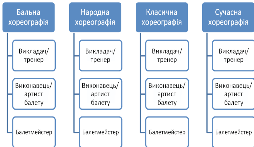
Схема 2. Запропонована модель вищої хореографічної освіти

Такий підхід має на меті диференціацію навчальних дисциплін та академічних годин задля того, щоб випускник був на 99 % готовий до максимально якісного виконання своїх обов'язків на займаний посаді.