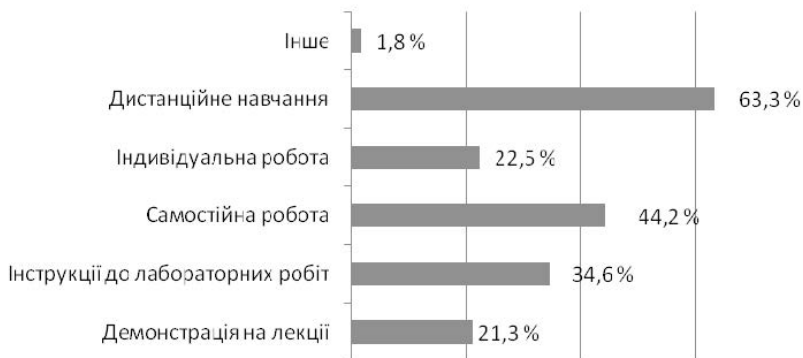
Рисунок 2. Види навчальної діяльності, на яких доцільно використовувати відео в навчальному процесі

суспільстві. Способи отримання, опрацювання, передавання даних значно різняться від тих, до яких звикли викладачі покоління «Х» та «У». Відео є мультимодальним, тобто задіює різні органи чуття, завдяки чому покращує сприйняття та засвоєння навчальних матеріалів. Об'єктивна суспільна значущість відео підтверджує доцільність його використання в навчальному процесі.