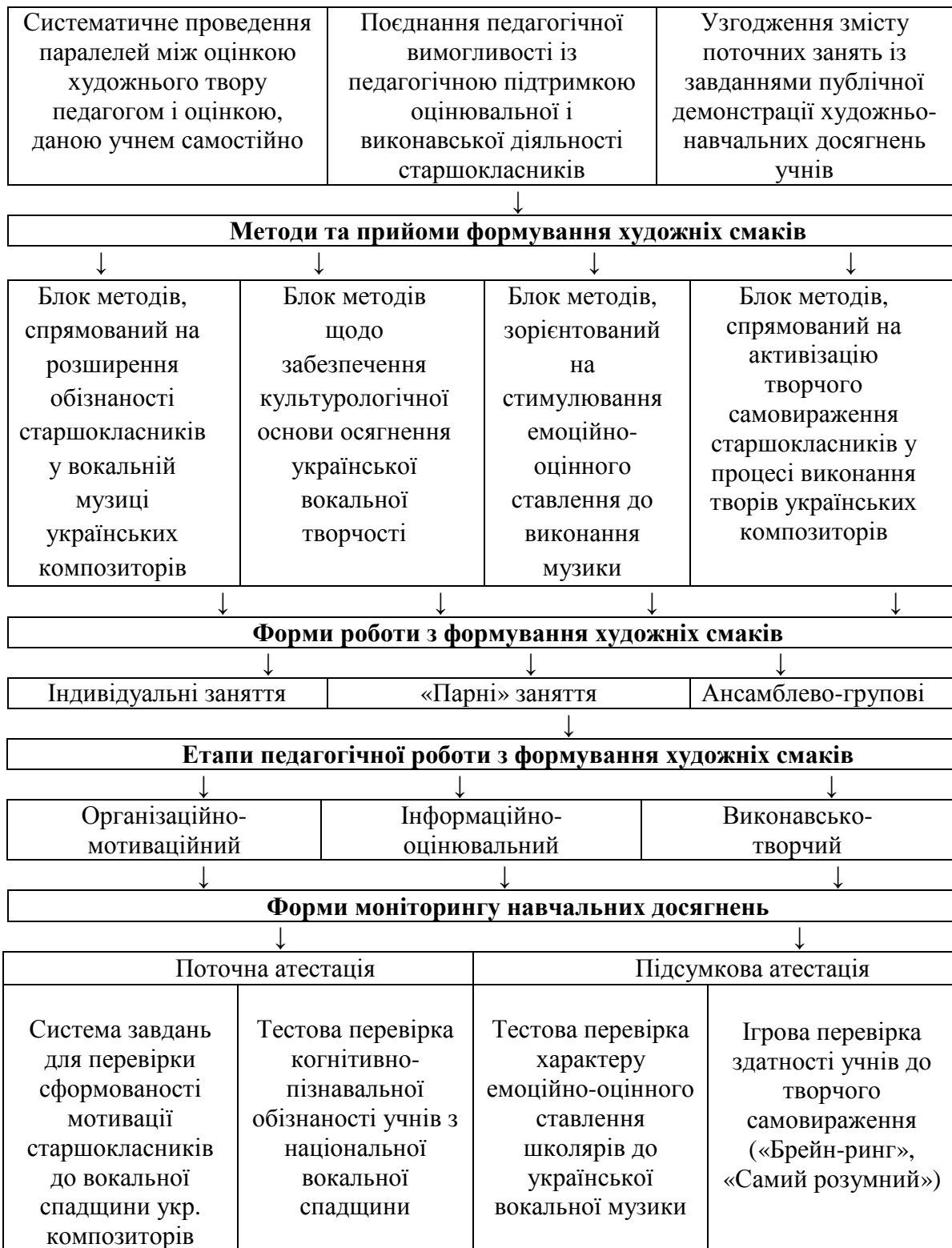
Рис. 1 Методична модель формування художніх смаків старшокласників у процесі вивчення вокальної спадщини українських композиторів

У третьому розділі – «Дослідно-експериментальна робота з формування художніх смаків старшокласників у процесі вивчення вокальної спадщини українських композиторів (кінець XIX – початку XX століття)» – описано способи організації, хід та результати констатувального, контрольного та формувального експериментів у процесі експериментально-дослідної роботи.