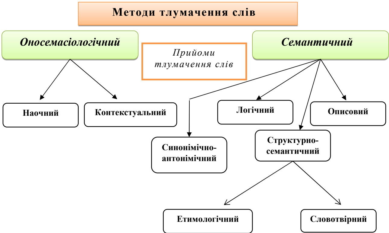
Рис. 1. Класифікація методів та прийомів тлумачення слів на засадах градаційності

Аналіз теоретичних джерел засвідчив, що важливим чинником формування лексичної компетентності в учнів початкових класів є організація роботи із запобігання мовленнєвих помилок. У дослідженні мовленнєві помилки й недоліки учнів початкових класів на основі класифікацій лексичних помилок було розподілено на три групи: 1) ненормативні значення слів (семантичні помилки); 2) ненормативна сполучуваність слів; 3) тавтологічні помилки і повтори. Крім того, у науковий обіг уведено особливий тип лексичних помилок, пов'язаний із недостатнім знанням учнями лексичного значення слова, – орфонімічні помилки: неправильне слововживання, пов'язане з незнанням точного значення слова, використання слова в невластивому для нього значенні, невідповідність ужитого слова тому поняттю, яке ним позначене в контексті і змісті усього висловлення загалом ( старий ветеран, пам'ятний сувенір ).