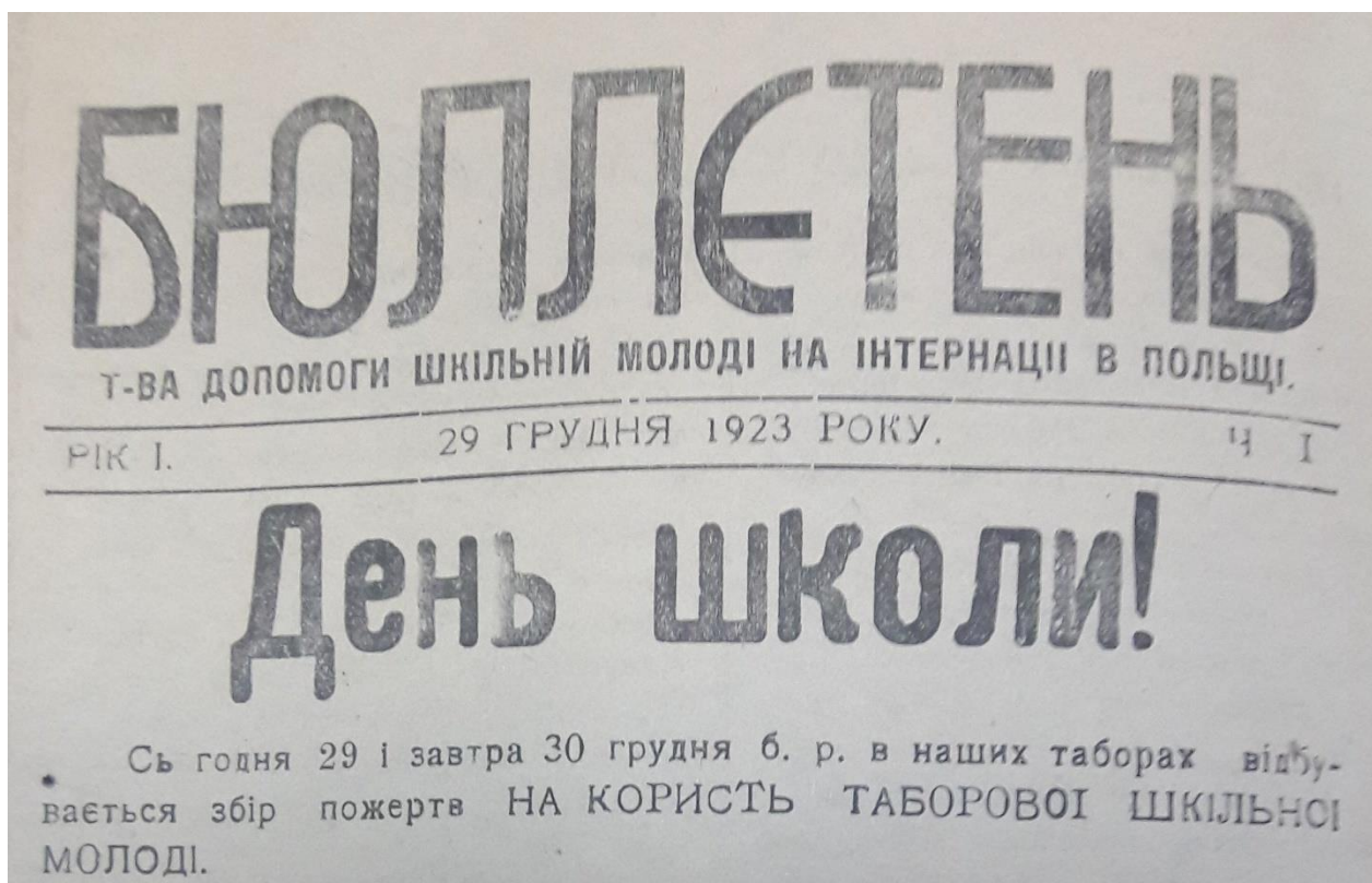
4. Верхня частина титульного аркушу першого числа «Бюллетеня Товариства Допомоги Шкільній Молоді на інтернації в Польщі» (б.м., 29 грудня 1923 р.), (ЦДАВО України, ф.2467, оп.1, спр.2)