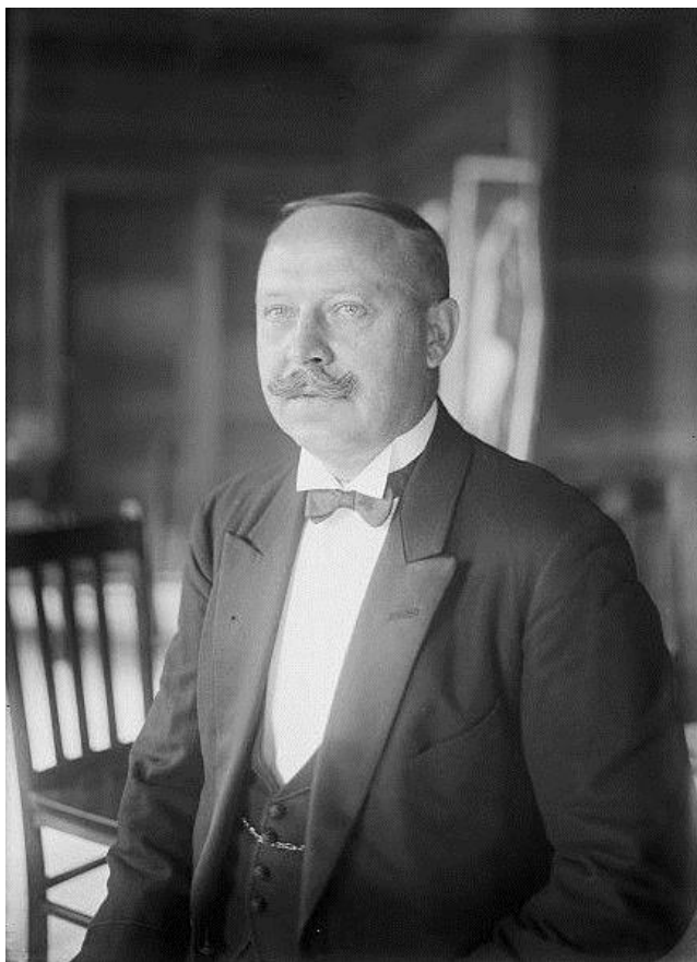
6. Керівник і диригент «Української Республіканської Капели» Олександр Кошиць – один з жертводавців «Товариства допомоги для Української шкільної молоді в таборах інтернованих в Польщі» (1920-ті рр.)