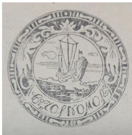
3. Логотип видавництва «Чорномор», яке допомагало грошовими внесками «Товариству допомоги для Української шкільної молоді в таборах інтернованих в Польщі» (був уміщений на бюлетенях «Товариства допомоги для Української шкільної молоді в таборах інтернованих в Польщі»).