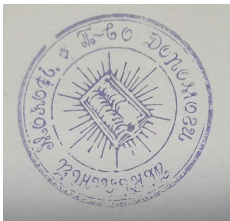
2. Печатка «Товариства допомоги для Української шкільної молоді в таборах інтернованих в Польщі» (ЦДАВО України, ф. 2467, оп. 1, спр. 3).