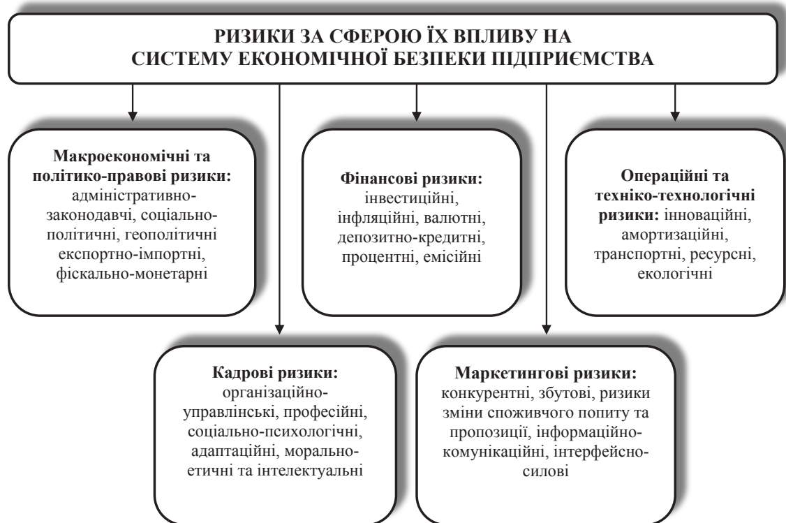
Рис. 2. Класифікація ризиків за сферою їх впливу на систему економічної безпеки підприємства

Імплементація функціонального підходу до визначення системи економічної безпеки підприємства дає змогу виділити в її структурі функціональні підсистеми, адекватне визначення складу яких дає можливість зменшити складність функціонування системи та підвищити вірогідність досягнення запланованого результату. З позицій цього дослідження економічна безпека підприємства буде залежати від відповідного рівня безпеки її інформаційної, фінансової, кадрової та інноваційно-інвестиційної функціональних підсистем. Це вима-