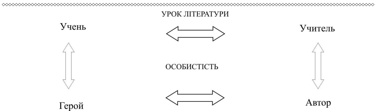
Рис. 1. Модель науково-методичної системи розвитку літературознавчої компетентності майбутніх учителів української мови і літератури

У розробці науково-методичної системи розвитку літературознавчої компетентності керувалися позицією, що її ядром є визначений цільовим блоком зміст літературознавчої компетентності студента ВПНЗ, що інтегрує в собі результати професійної підготовки майбутніх педагогів-філологів. Складники змісту літературознавчої компетентності визначаються професіограмою вчителя української мови і літератури як узагальненою його інваріантною описово-технологічною характеристикою, що може бути предметом окремого наукового дослідження.