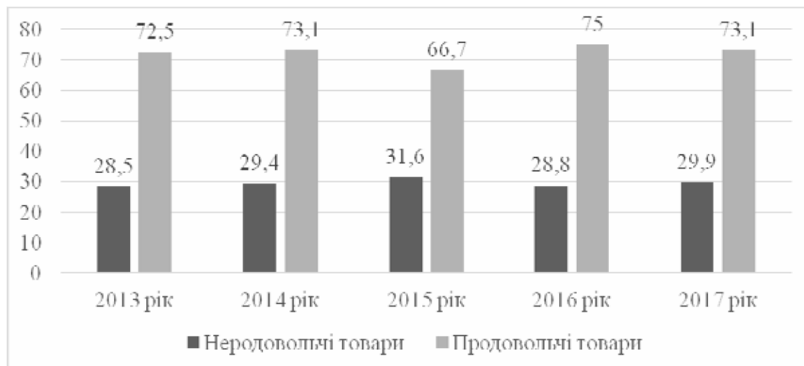
Рис. 2. Частка продажу товарів вироблених в оптовому товарообороті міста Києва за період 2013-2017 рр., % Джерело: складено авторами за даними [5]

Щодо оптової торгівлі, то частка продажу товарів вироблених в оптовому товарообороті міста Києва у 2017 р. у розрізі продовольчих та непродовольчих товарів складає 73,1 % та 29,9% відповідно (рис.2).