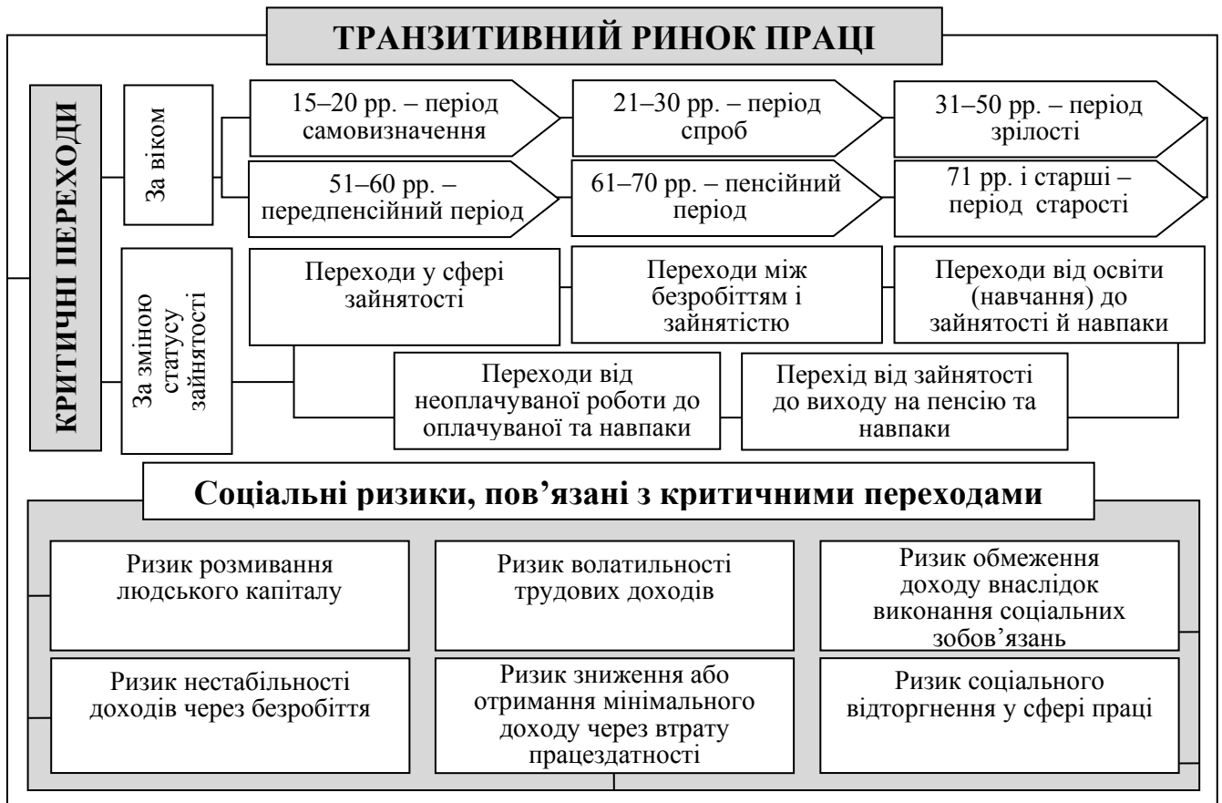
Рис. 1. Транзитивний ринок праці та ризики критичних переходів

Врахування життєвого циклу людини у дослідженні ТРП дає змогу якнайповніше зрозуміти зміни мотиваційних настанов та освітньо-професійних траєкторій, що перебувають як під впливом зовнішніх чинників, так і зумовлені внутрішніми епізодичними або випадковими потрясіннями в житті людей на кожній фазі життєвого циклу.