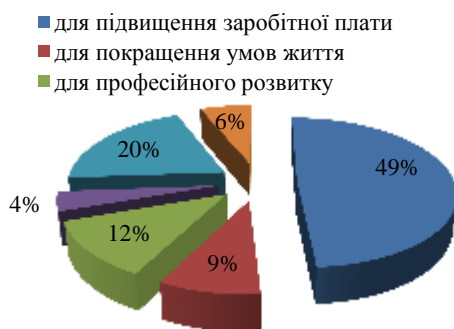
Рис. 1. Значення професійної мобільності для вчителя іноземної мови.

За результатами вибору рангові позиції були розподілені наступним чином: для підвищення заробітної плати – 48,9%, для покращення умов життя – 8,7%, для професійного розвитку – 12%, для особистісного розвитку – 4,2%, всі вище зазначені варіанти – 20%, ваш варіант відповіді – 6,2%. Результати опитування представлені на Рис. 1.