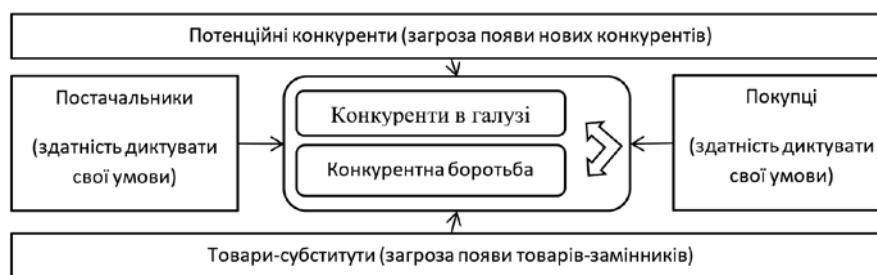
Рис. 1. Сили, які визначають галузеву конкуренцію [10]

Модель «5 сил М. Портера». Цей метод є ефективним для визначення найбільш детальної оцінки головних факторів та сили їх впливу на КС підприємства. Модель містить 5 головних факторів впливу (рис. 1).