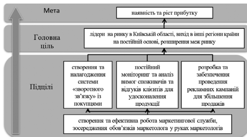
Рис. 4. «Дерево цілей» підприємства «Валькірія»

Коли «дерево проблем» побудоване, у підприємства є чітке уявлення того, на що необхідно направити свої зусилля. Для якісного формулювання варто здійснити перетворення негативних тверджень на позитивні, що в результаті визначить основні цілі діяльності підприємства для підвищення ефективності та конкурентоспроможності. Для повного бачення сформованих цілей нашим заключним етапом була побудова «дерева цілей», де на верхньому рівні знаходиться головна мета, у центрі – головна ціль (цілі), а на нижньому рівні – підцілі, завдання для досягнення цілей (рис. 4).