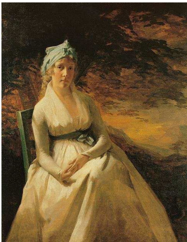
Іл.4. Генрі Реберн. Портрет місіс Ендрю. 1795р. Художній музей «Джослін», Омаха, Небраска, США