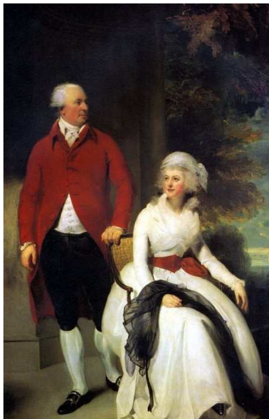
Іл.1. Томас Лоуренс. Портрет Джона Джулиуса Андерсона. 1790. Ангерштейн з дружиною. мистецтв, Вашингтон, США 1790-1792рр. Париж, Лувр