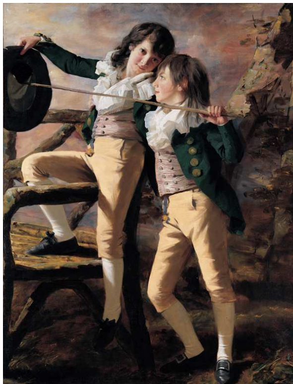
Іл.3. Генрі Реберн. Портрет Джеймса і Джона Лі Аллен. 1790-ті рр. Художній музей Кімбелл, Форт-Уерт, Техас, США