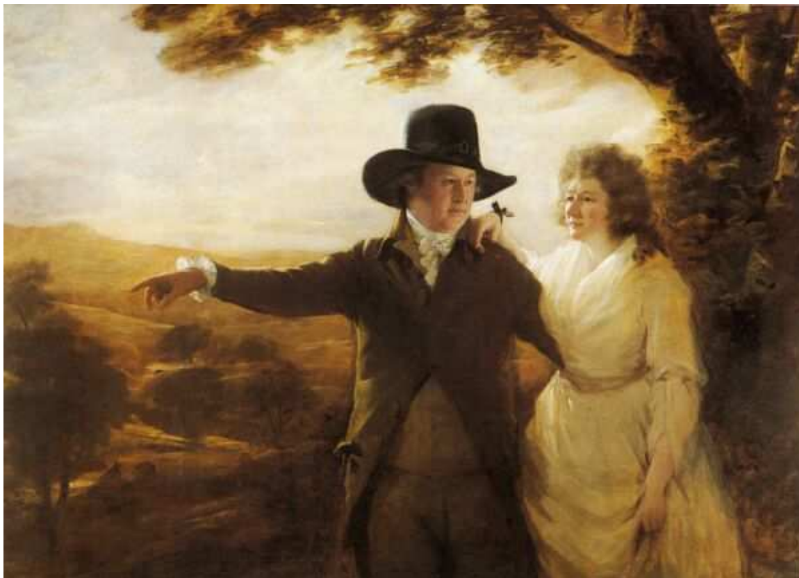
Іл.5. Генрі Реберн. Портреті Сера Джона і леді Клерк. 1792р. Великобританія, приватне зібрання Альфреда Бейта