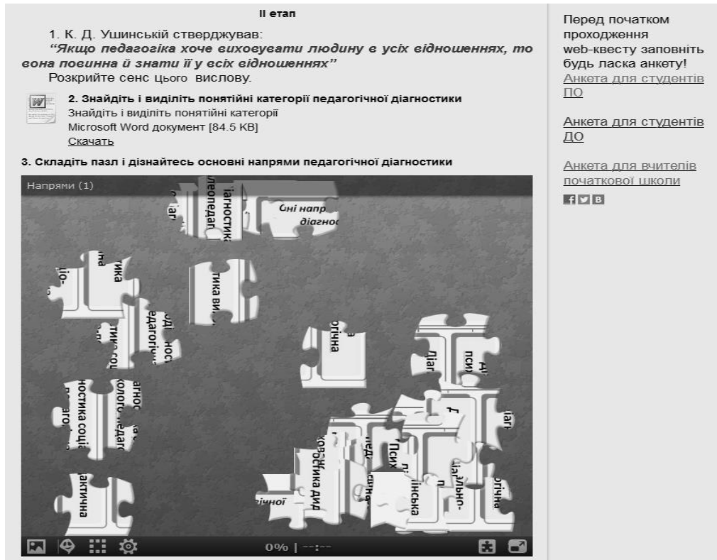
Рис. 3. II етап web-квесту "Вчитель-діагност"

На III етапі дати характеристику методів педагогічної діагностики; скласти анкету для батьків та план бесіди з дітьми (тема "Пізнавальний інтерес шести-семи річних дітей").