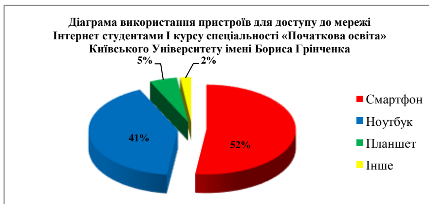
Рис. 2. Використання пристроїв для доступу до мережі Інтернет

Результати свідчать (див. Рис.2), що свідчать, що більшість студентів мають постійний доступ до мережі Інтернет (94%), використовують його вдома (85%), і лише 6% не мають доступу до мережі. 52% опитуваних користуються смартфонами, 41% ноутбуками.