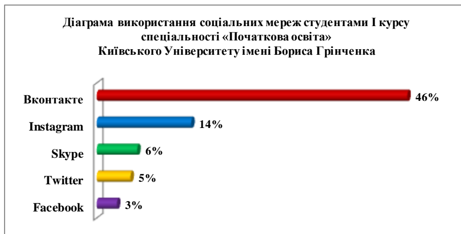
Рис. 3. Використання соціальних мереж студентами

Більшість опитуваних студентів користуються соціальною мережею «ВКонтакте» — 46%, «Instagram» — 14%, інша частина користуються «Skype» та «Twitter» (див. Рис. 3). Майже 45% респондентів проводить у соціальних мережах більше 6-ти годин, з них в навчальних цілях лише 11%. Студенти вважають, що соціальні мережі доречно використовувати для оперативного доступу до навчальних матеріалів, зв'язку з викладачем та колективного виконання домашнього завдання, проведення занять в дистанційному режимі.