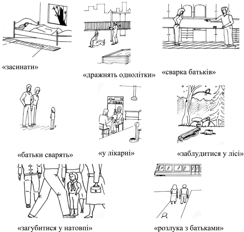
Рис. 1. Зображення для інтерв'ю

Дітям пропонується переглянути вісім малюнків (див. Рис. 1.), які супроводжуються короткою історією. Кожен із восьми малюнків, разом з історією до нього, ілюструє потенційно загрозливу ситуацію.