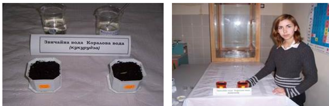
Рис. 11 – 12. Висівання насіння кукурудзи і квасолі у ґрунт