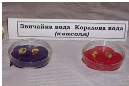
Рис. 5 – 6. Пророщування насіння кукурудзи і квасолі