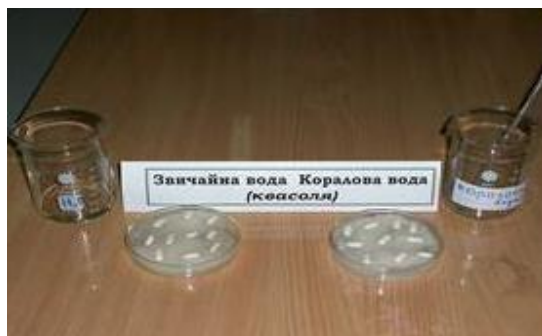
Рис. 3 – 4. Закладка експерименту