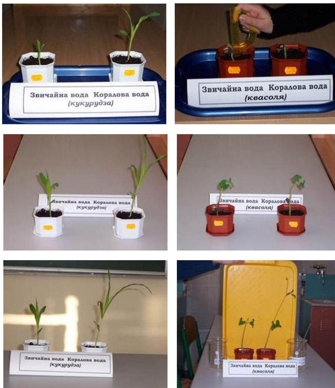
Рис. 13 – 18. Ріст та розвиток сходів кукурудзи і квасолі залежно від поливу