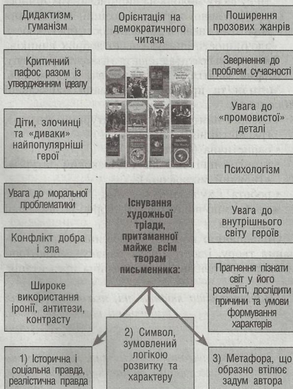
Схема 2 Провідні риси творчості Чарльза Діккенса