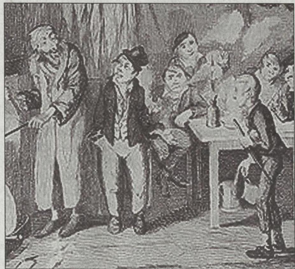
Джордж Круікенк. «Спритний Пройда знайомить Олівера з Фейгінном»

Злочинний світ Діккенс зображує таким потворним, яким він є насправді. Він відрізняється від того привабливого опису благородних розбійників «з великої дороги», який звикли бачити читачі у «ньогоетських» романтичних романах.