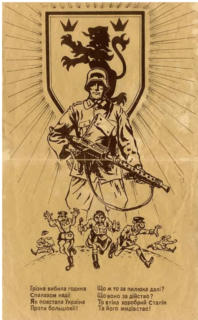
Рис. Д. 1. Німецькі пропагандистські плакати із закликами вступати до дивізії (1943-1944 рр.) *