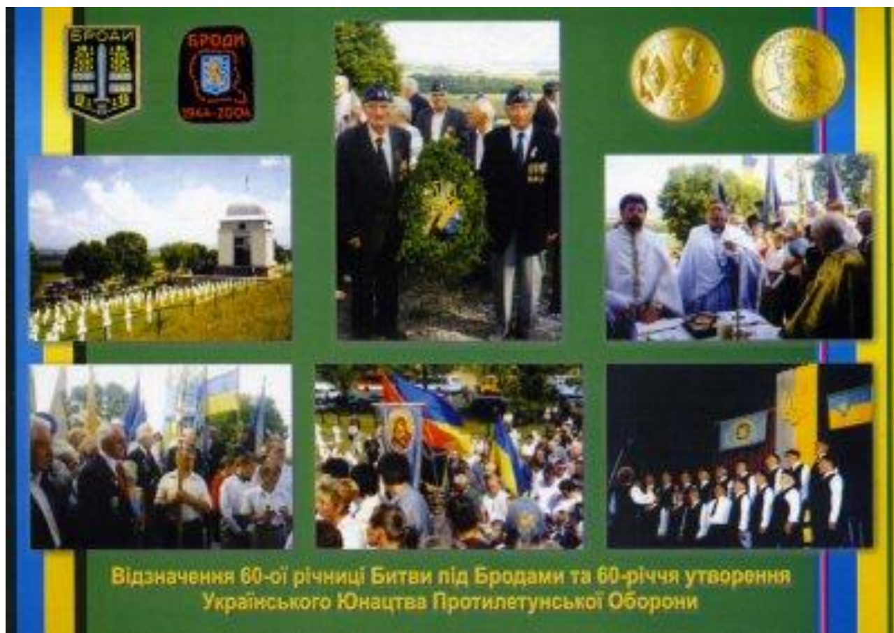
Рис. 3.1. Листівка «Відзначення 60-ої річниці Битви під Бродами та 60-річчя утворення Українського Юнацтва Протилетунської Оборони»*