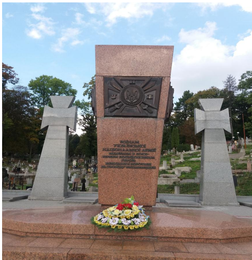
Рис. О.1. Меморіал воякам Української національної армії на Личаківському кладовищі*