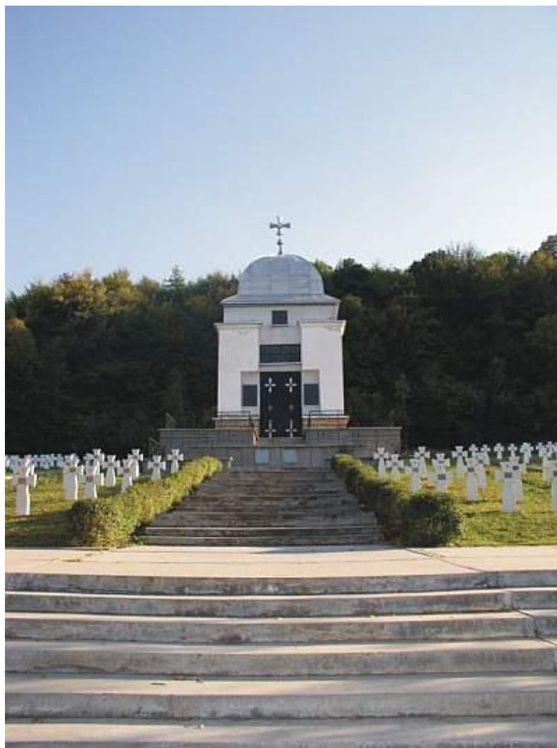
Рис. Н.1. Цвинтар-меморіал у с. Червоне, Золочівський район, Львівська обл.*