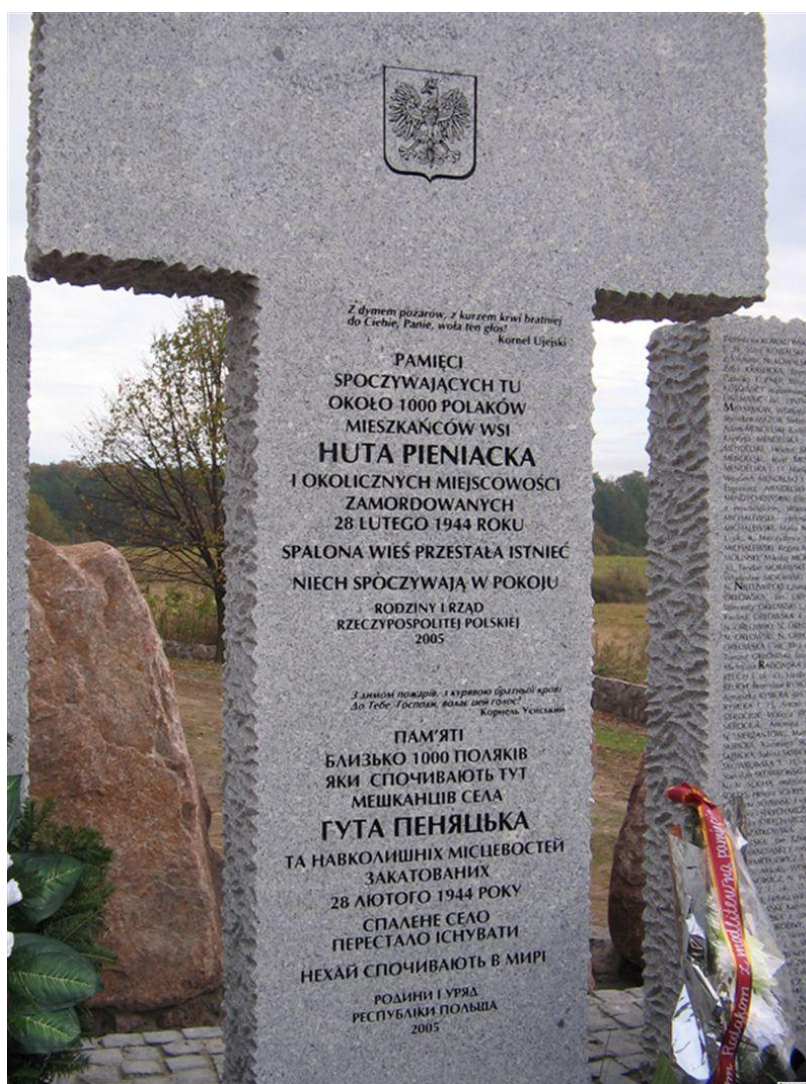
Рис. К.1. Пам'ятник загиблим жителям Гути Пеняцької, споруджений на місці знищеного села у 2005 р.*