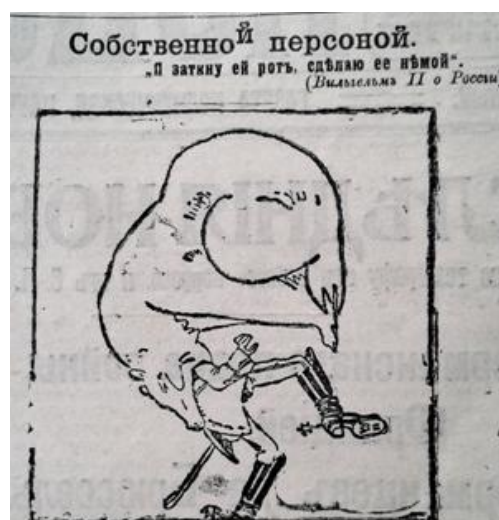
Рис. 4. Собственной персоной (Последние новости. 30 июля 1914 г. № 2499)

Для підсилення ефекту сприйняття побаченого та надання зображенню символічного контексту авторами сатиричної графіки застосовувався прийом зооморфної алегорії, тобто уподібнення до тварин. Карикатура “Собственной