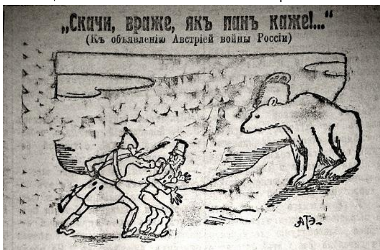
Рис. 7. Скачи, враже, як пан каже (Последние новости. 1914. 3 августа. № 2508)

Значна частина тогочасної сатиричної графіки була присвячена дискредитації та висміюванню відносин між німцями та їхніми союзниками. У карикатурі “Скачи враже, як