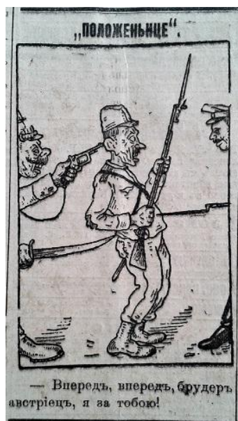
Рис. 8. Положеньце (Южная копейка. 1916. 3 июля. № 1916)

Разом з тим, окремі карикатури були присвячені ставленню німецького імператора до лідерів інших країн Четверного союзу. Зокрема, в одній із них турецького султана зображено у вигляді маріонетки, якою вдало маніпулює Вільгельм II (рис. 9) [13, с. 4]. Інша карикатура відображала характер відносин між Німеччиною та Болгарією: німецький кайзер штовхає болгарського царя і наказує йому беззаперечно коритися (рис. 10) [14, с. 3]. У суспільній думці утверджувалась ідея про нерівноправність союзницьких відносин між країнами Четверного союзу і, що для Німеччини Туреччина та Болгарія виступали лише джерелом матеріальних і людських ресурсів у війні за світове панування.