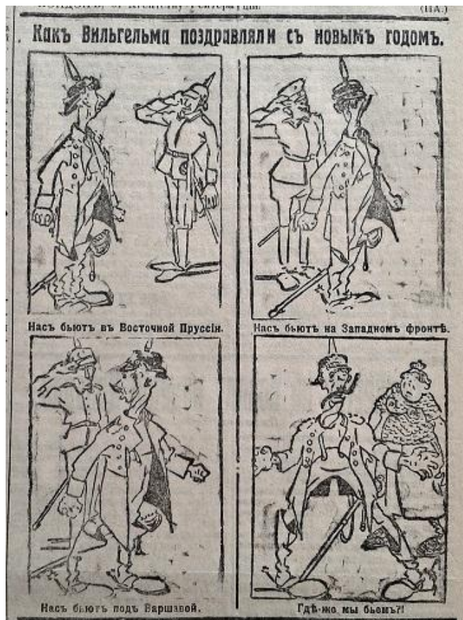
Рис. 11. Какъ Вильгельма поздравляли с новым годом (Южная копейка. 1915. 5 января. № 1424)