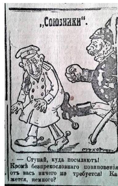
Рис. 10. Союзники (Южная копейка. 1916. 24 января. № 1853)

Одним із тематичних напрямків карикатур було демонстрування факту постійних військових невдач ворога. Наприклад, в газеті “Южная копейка” була розміщена ілюстрація “Як Вільгельма привітали з новим роком” на якій відображено донесення німецького офіцера імператору про поразки на різних ділянках Західного та Східного фронтів і реакція кайзера на такі факти: “Нас б’ють у Східній Пруссії. Нас б’ють на Західному фронті. Нас б’ють під Варшавою. А де ж ми б’ємо?!” (рис. 11) [15, с. 3].