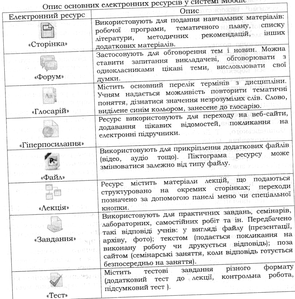
Таблиця 1 Опис основних електронних ресурсів у системі Moodle

У таблиці 1 подано опис основних електронних ресурсів, що використовують для створення навчального курсу з української мови як особливої форми взаємодії університету і профільної школи [7].