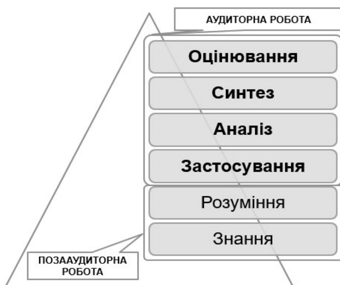
Рис. 3. Використання перевернутого навчання та таксономія Блума

Для ефективного використання відео-матеріалів під проектування електронного навчального курсу розглянемо детальніше освітню мету застосування технології перевернутого навчання (рис.3.), яка може базуватися на таксономії Блума [6], модифікованій Андерсоном та Кратволом [1]. Відповідно до цієї таксономії існує шість рівнів когнітивних здобутків: знання, розуміння, застосування, аналіз, синтез і оцінювання. У перевернутому навчанні те, що студенти виконують в рамках позааудиторної роботи, належить до знань і розуміння, тобто до нижчих рівнів когнітивного навчання, адже відео-матеріали використовуються для ознайомлення студентів з базовим матеріалом. Під час проведення аудиторних занять формуються навички вищих рівнів когнітивного мислення, такі як аналіз, синтез та оцінювання [8]. Роль викладача в аудиторії змінюється – він стає ведучим, застосовує дискусії, організовує спільну навчальну діяльність, групову роботу, проекти, сприяє розвитку у студентів здатності до саморефлексії.