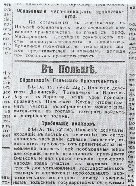
Зобр. 8. Рубрики Закордоном та В Польщі у газеті Слово (19. 10. 1918), № 16, 3

герцога Каннауцького, а соціал-демократи бажують республіки на чолі з президентом – Едвардом Бенешем і міністром-президентом Крамаржем» (Слово [6]). Як бачимо з тексту повідомлення, в тогочасному чеському середовищі існувало два основні напрями розбудови держави: монархічний та республіканський.