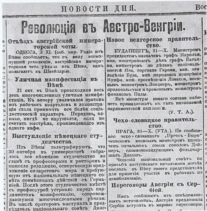
Зобр. 7. Рубрика Революція в Австро-Угорщині у газеті Новости дня (3. 11. 1918), № 45, 2