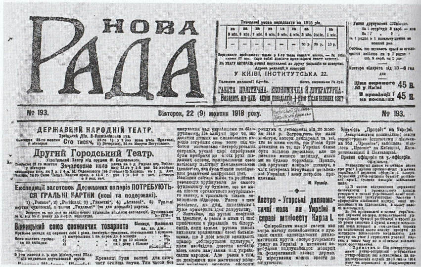
Зобр. 1. Перша сторінка газети Нова Рада

Нова Рада презентувала себе як національний виразник, то інші дві газети виявляли російську позицію.