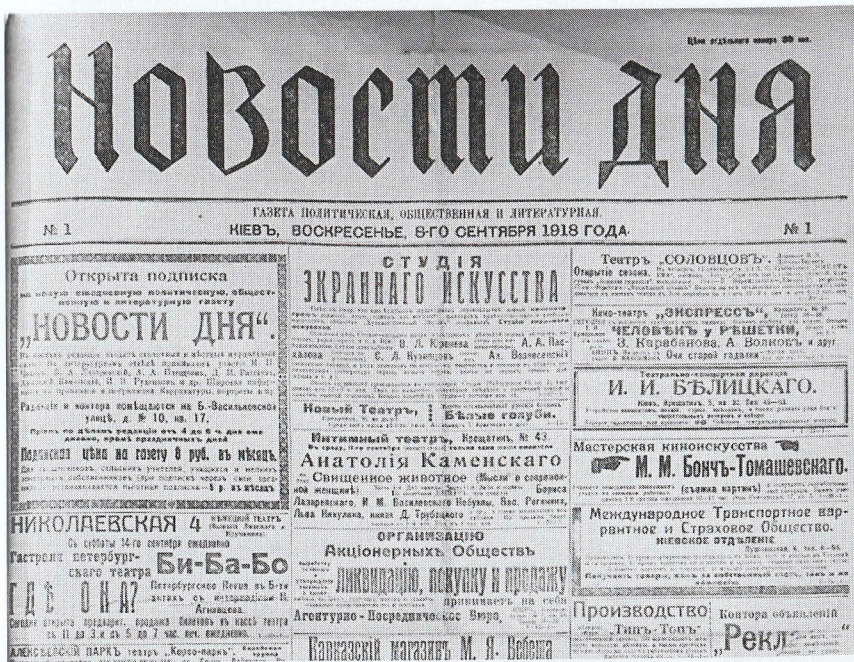
Зобр. 2. Перша сторінка газети Новости дня

30 руб. (Нова Рада [5]). Нова Рада містила доволі широку кількість спеціальних тематичних рубрик про внутрішньо- та зовнішньополітичні події. На 1-й та 2-й сторінках зазвичай розміщували інформацію про українські події, а на 3-й сторінці розташовували обширну рубрику за назвою Телеграми , де подавали найбільш актуальні події за кордоном і, зокрема, висвітлювали чехословацке питання.