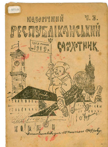
Рис. 2. О.П. Курилас. Обкладинка видання «Республіканський самохотник». 1919 рік. Ч. 3