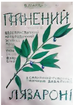
Рис. 3. В.І. Касіян. Обкладинка видання «Лязароні». 1919 рік. Ч. 3

Митець зробив дотепний автошарж, де показана фігура художника у повний зріст з палі-