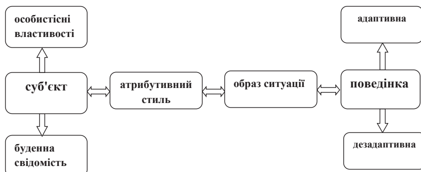
Рис. 2. Функціональна модель становлення атрибутивного стилю особистості дорослих

У досліджуваній системі взаємодії «суб'єкт – ситуація» атрибутивний стиль дорослої людини сприяє формуванню образу ситуації у свідомості суб'єкта, а отже, опосередковує вибір суб'єктом стратегії реагування, яка буде адаптивною чи навпаки, дезадаптивною. Виходячи з цієї схеми, у дослідженні становлення атрибутивного стилю дорослого можна говорити насамперед про становлення адаптивних можливостей атрибутивного стилю.