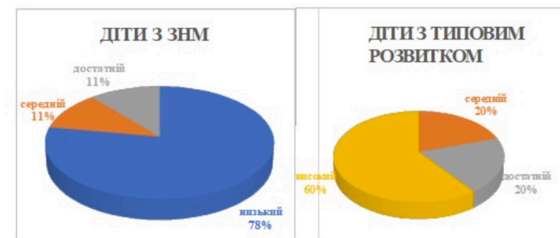
Рис. 3. Рівні сформованості емоційно-ціннісної компетентності дітей молодшого дошкільного віку

Констатовано, що найнижчими показниками характеризується рівень сформованості у дітей молодшого дошкільного віку із ЗНМ емоційно-ціннісної компетентності, так більшість – 78%, мають низький рівень сформованості зазначеної компетентності. У дітей молодшого дошкільного віку з типовим розвитком показники зазначеної компетентності також є зниженими порівняно з їх показниками за іншими компетентностями, проте в порівнянні з рівнем сформованості цієї компетентності у їх однолітків із ЗНМ виявлено значно вищі показники: більшість – 60% дітей з типовим розвитком мають високий рівень сформованості цієї компетентності (рис. 3).