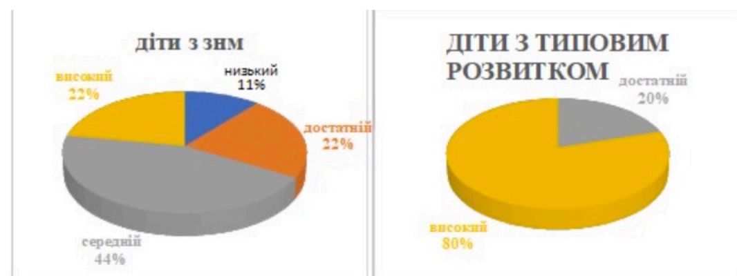
Рис. 1. Рівні сформованості родинно-побутової компетентності у дітей молодшого дошкільного віку

В ході проведення якісної і кількісної обробки результатів дослідження родинно-побутової компетентності дітей молодшого дошкільного віку із ЗНМ часто спостерігались незнання імен мам чи тата, плутання в іменах або надання дитиною на запитання «Як звати тата і маму?» відповіді: що вона не знає або просто «мама» чи «тато». Зазвичай ці діти проявляли цікавість до занять членів сім'ї, а також прагнули допомагати, однак швидко втрачали інтерес до тої чи іншої діяльності, замінюючи її на предметну діяльність з іграшками.