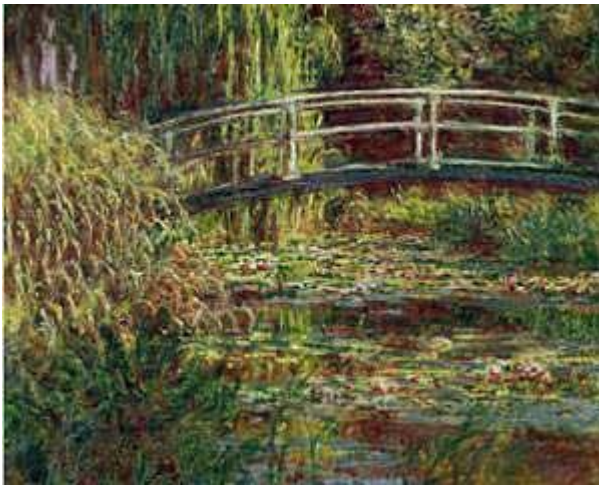
Рис. 1.1. К. Моне. «Пруд з лататтям». Полотно, олія.