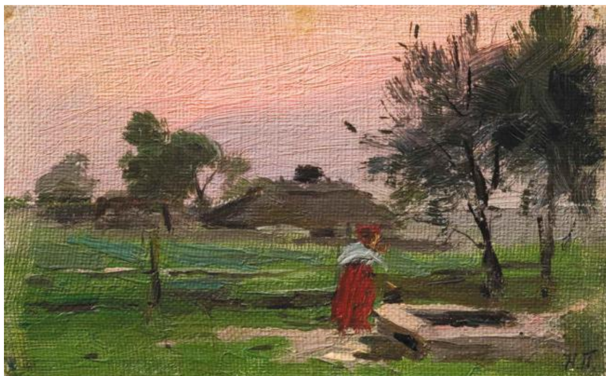
Рис. 2.2. М. Пимоненко. «Біля колодязя». Полотно, олія