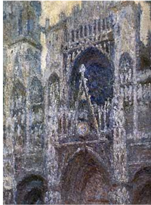
Рис. 1.2. К. Моне. «Руанський собор». Полотно, олія