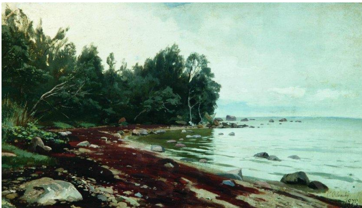
Рис. 2.1. В.Орловський. «Залив». Полотно, олія