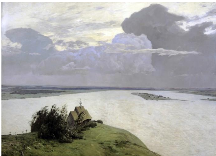
Рис. 1.3. І. Левітан. «Над вічним спокоєм». Полотно, олія