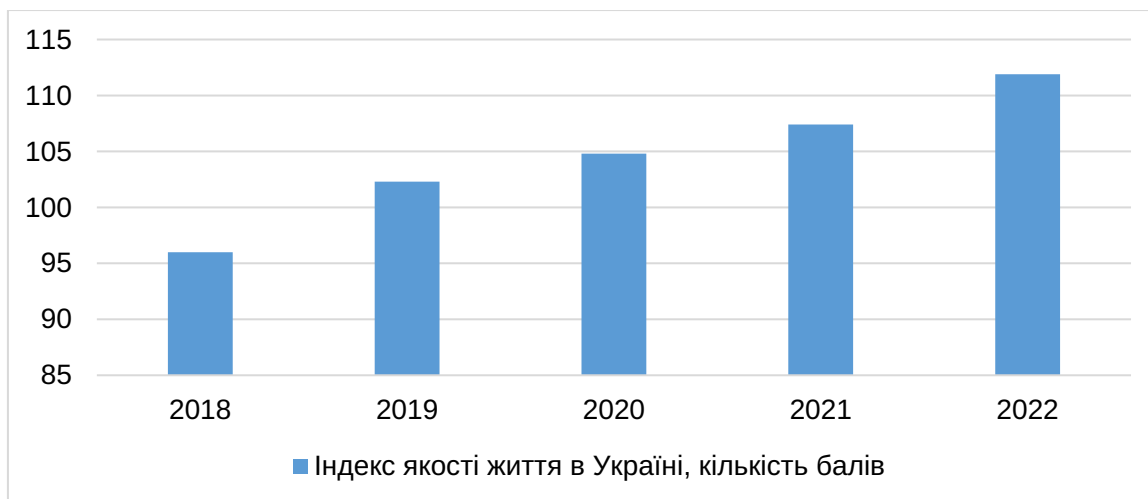
Рис. 5. Динаміка Індексу якості життя в Україні, кількість балів