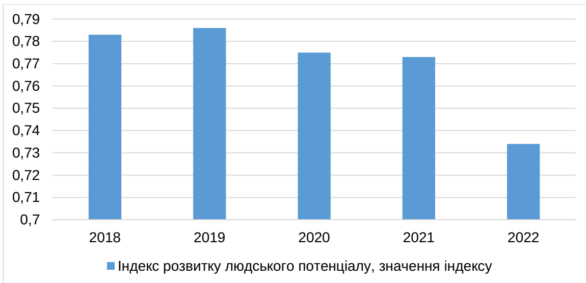
Рис. 3. Динаміка індексу розвитку людського потенціалу, значення індексу