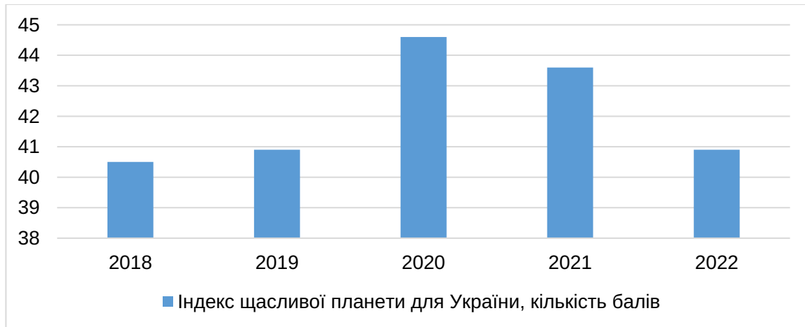
Рис. 7. Динаміка Індексу щасливої планети, кількість балів

Джерело: складено авторами за даними World Happiness Report [14]