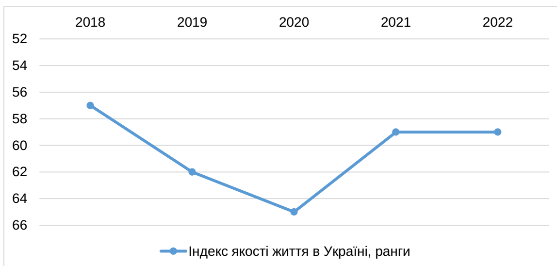
Рис. 6. Динаміка Індексу якості життя в Україні, ранги