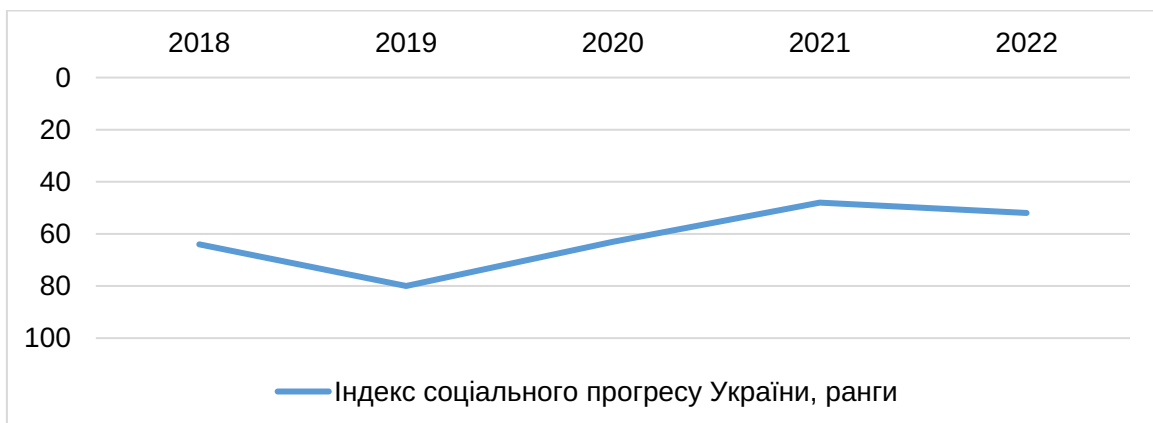
Рис. 2. Динаміка індексу соціального прогресу України, ранги