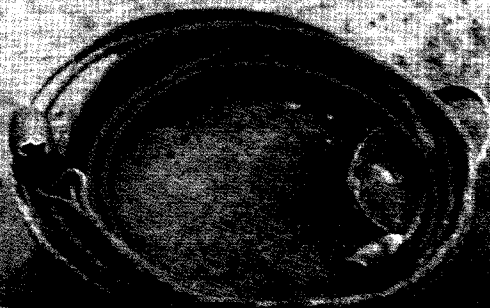
МЕЛЬНИКИ 1 постр. 1