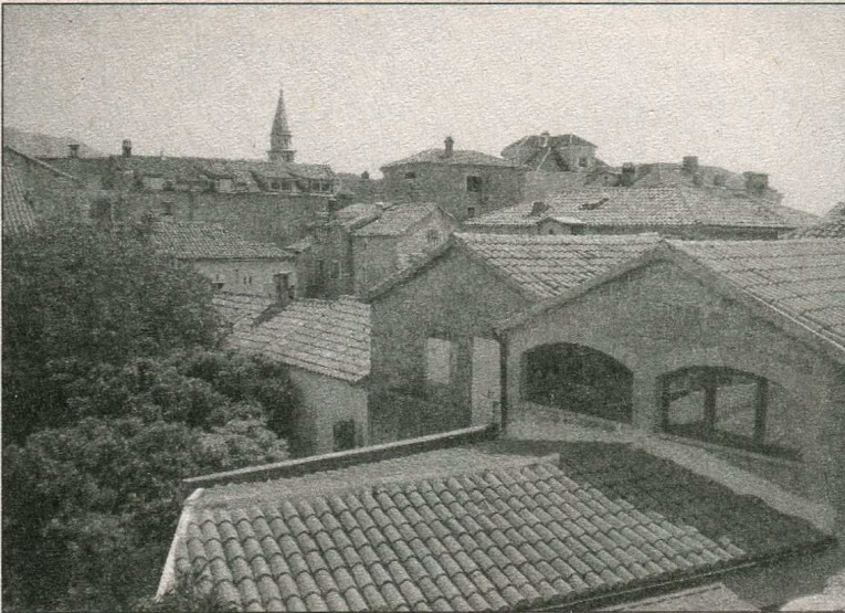
Дахи старої Будви

2 об'єкти природи в межах Чорногорії занесено до Списку Всесвітньої спадщини ЮНЕСКО і 5 – до попереднього списку на перспективу для включення. Почесне місце серед них посідає Національний парк Дурмитор з каньйоном річки Тари. Це один з найбільших у Європі і в світі каньйон з прямовисними скелями-стінами, який річка Тара пробила серед мальовничих гір. Але його не можна порівнювати, наприклад, з каньйоном річки Колорадо. Чому? Колорадо несе брудну каламутну воду, а вода річки Тари по всій її течії чиста, прозора, її можна навіть пити.