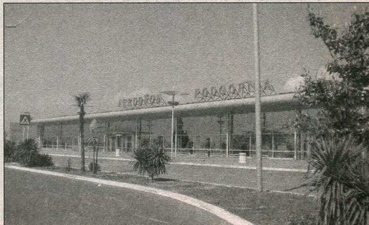
Міжнародний аеропорт у Подгориці

в 1918 р. вона увійшла до складу Королівства сербів, хорватів і словенців.