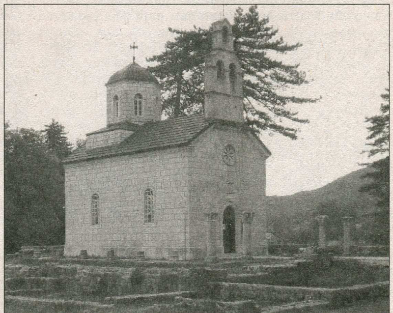
Храм Різдва Богородиці в м. Цетіне

Регіон Бока-Которська, який інколи називають нареченою Адриатики, відомий своїми давніми містами та глибокою затокою, оточеною високими горами. Це найбільш сонячне місто Адриатики. Бока-Которська затока має чотири маленьких затоки: Которська, Рисанська, Тивашська, Токланська. Узбережжя всіх їх, наче шия нареченої, охоплене намистинками перлів – маленькими казкової краси містами з баштами, охайними дво- та триповерховими кам'яними будиночками, що вкриті червоною черепицею, та дзвіницями церков, які вражають красою своєї скромної архітектури.