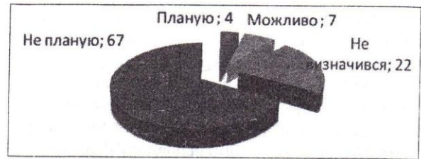
Рис. 2. Планування професійної діяльності, пов'язаної з дітьми, які мають особливості психофізичного розвитку

Блок «Мотивація». У ході опитування нами з'ясовано, що переважна більшість старшокласників обох шкіл не планують пов'язувати свою професійну діяльність з дітьми, які мають особливості психофізичного розвитку (67%), лише близько 11% опитуваних припускає таку можливість, а 22% не можуть визначитись (див. Рис. 2).