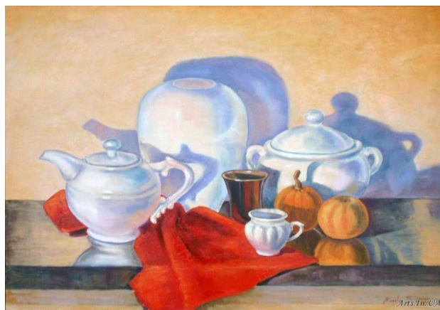
Рис. 2. В. Жиров. «Игра теней»