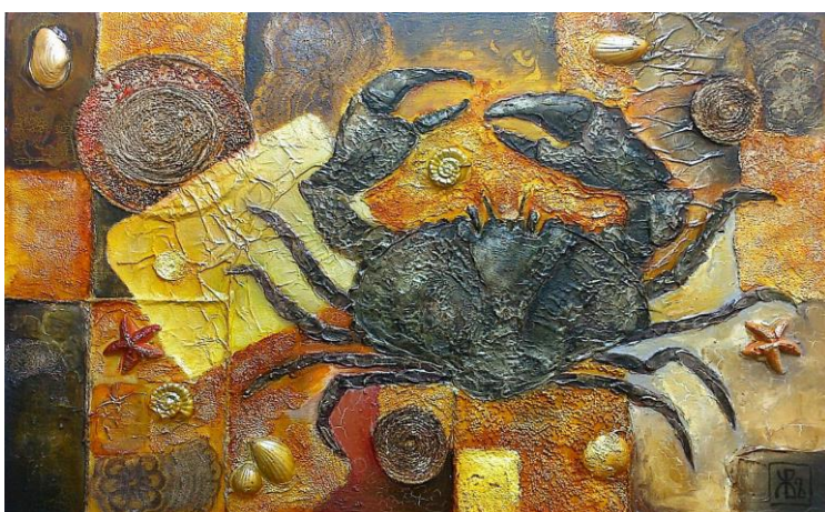
Рис. 3. В.Жиров. «Краб» «Консерватизм»