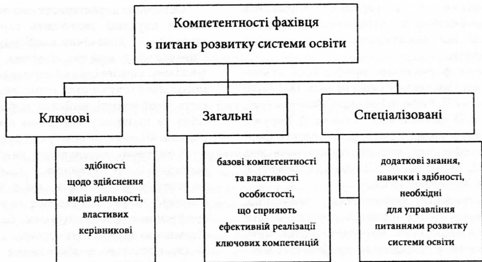
Рис. 1. Модель компетентності фахівця з питань розвитку системи освіти

Бачимо, що модель побудована з урахуванням послідовності у вивченні навчальних дисциплін, характерних для компетентнісного підходу до навчання. Теоретичний аналіз запропонованої моделі компетентності фахівця з питань розвитку системи освіти дає можливість згрупувати компетентності, якими мають володіти експерти у галузі освіти, за трьома провідними групами компетентностей. Розкриємо їх зміст.