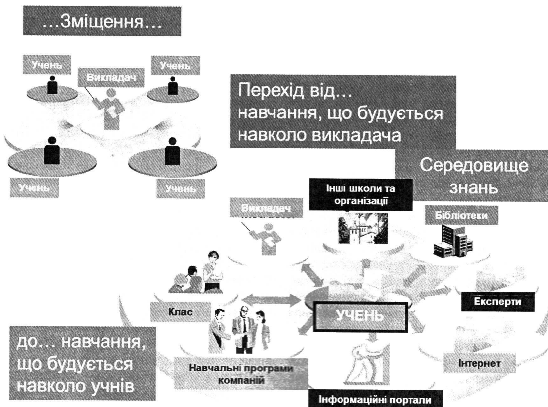
Мал. 1. Поєднання самостійного навчання з викладанням учителя