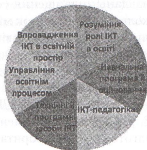
Рис. 1 Компоненти освіти в умовах інформаційного суспільства

На нашу думку, головною умовою переходу від традиційної педагогіки до нової як альтернативної