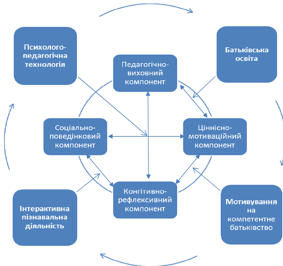
Рис. 1. Міжкомпонентні зв'язки батьківської компетентності в сукупності з психологічними умовами їх формування

технологія спрямована на перетин взаємозв'язків між усіма компонентами. Водночас усі психологічні умови здійснюють комплексний вплив на всі структурні компоненти батьківської компетентності молодого подружжя. Ці міжкомпонентні зв'язки у структурі батьківської компетентності в сукупності з психологічними умовами її формування зображено на рис. 1.