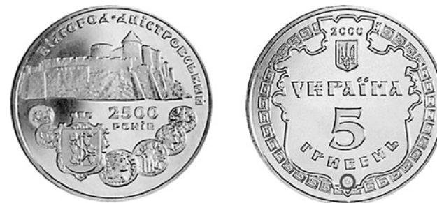
Рис. 2. Монетний знак Банкотно-монетного двору Національного банку України на аверсі ювілейної монети «Білгород-Дністровський» серії «Стародавні міста України»

Деталізуючи зовнішній вигляд монети, зазначимо розміщення на аверсі малого Державного герба України, стилізованих написів: «2000», «Україна», «5 гривень» в два рядки та логотипу Монетного двору Національного банку України, закомпонованих на фоні гербового картуша в обрамленні грецького меандру. На реверсі зверху півколом розміщено напис «Білгород-Дністровський», нижче зображено Акерманську фортецю XV ст. з боку Цитаделі та Комендантської вежі. Під зображенням в два рядки зазначено ювілейну дату міста: «2500 РО-