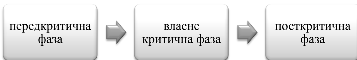
Рис. 1. Фази кризи професійного розвитку

Розгортання професійного шляху суб'єкта праці супроводжується різкими змінами вектору професійного розвитку, які Е.Ф. Зеєр називає кризами, наголошуючи, що вони особливо яскраво проявляються при переході від однієї стадії фахового становлення до іншої [5, с. 213]. Педагог є особистістю, що в силу специфіки професійної діяльності, спрямованої на системну взаємодію з іншими людьми, має розвинену самосвідомість. В ході переживання вчителем криз професійного розвитку відбувається перебудова смислових структур професійної свідомості, перехід особистості на якісно новий рівень сприймання, рефлексії та оцінювання себе в умовах фахової діяльності. Аналіз та ревізія внутрішніх та зовнішніх умов професійної діяльності забезпечують зміну Я-концепції вчителя відповідно до нових обставин праці. Професійна самооцінка як структурний компонент Я-концепції педагога виступає лакмусом характеру цих змін – сприятливого, прогресивного чи, навпаки, руйнівного. Оцінювання себе як суб'єкта праці активізується вже на початку кризи і триває впродовж всієї кризи відповідно до її фаз. Ці фази виокремлені Е.Ф. Зеєром у відповідності до ідей Л.С. Виготського про поетапний перебіг вікових криз [5, с.215].