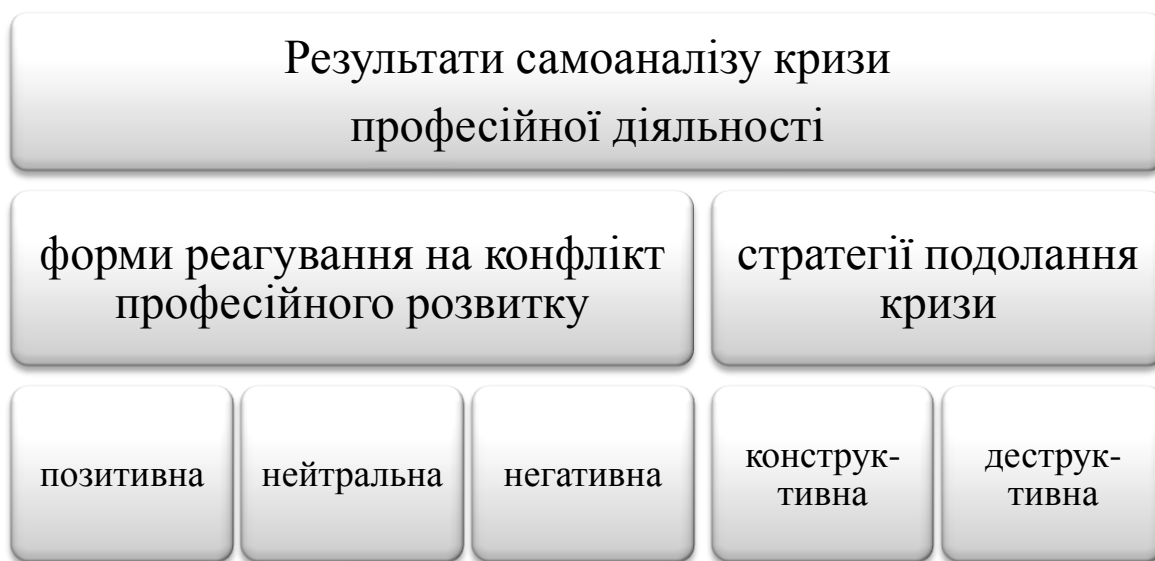
Рис. 3. Наслідки рефлексії кризи професійного розвитку

Як вже зазначалось, поява конфлікту професійного розвитку та його усвідомлення суб'єктом праці викликає активізацію рефлексивних процесів. В залежності від змісту самоаналізу формуються різні наслідки рефлексії кризи професійної діяльності щодо суб'єкта праці: