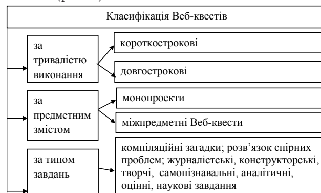
Рис. 1. Класифікація Веб-квестів (за дослідженнями Берні Джорджа)

Науковцями, зокрема Б. Доджем [4, с. 125], виокремлено види Веб-квестів. На основі його досліджень нами розроблена класифікація Веб-квестів (рис. 1).