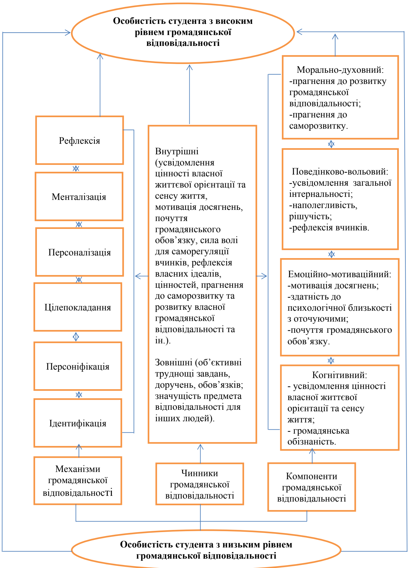
Рис. 1. Психологічна модель громадянської відповідальності особистості