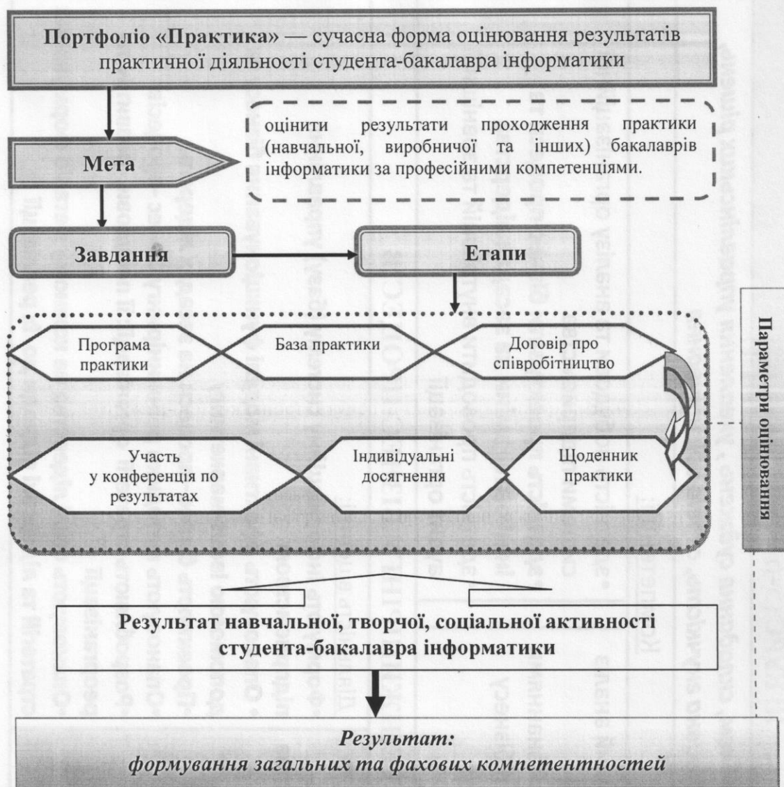
Рис. 2 Портфоліо як форма оцінки результатів практики студентів-бакалаврів інформатики

Тому натеper у системі освіти вищого навчального закладу під портфоліо розуміють цільову вибірку робіт студента (обраних на основі певного критерію), що розкривають його успіхи і досягнення в навчальній дисципліні. При цьому чітко визначаються критерії оцінки досягнень, ретельно підбираються докази його самостійної роботи. Таким чином, добірка містить кращі роботи або починання студента, обрані ним приклади досвіду практичної роботи, пов'язані з оцінюваною областю знань, а також супровідні документи, що свідчать про зростання або розвиток та підтверджують його досягнення в оволодінні предметом. Портфоліо дозволяє виявити важливий з точки зору сучасних пріоритетів у змісті освіти набір компетентностей , сприяє кращому